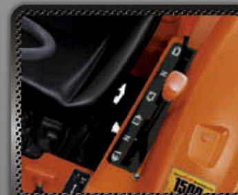
เกียร์ซินโคร ชัทเทิล เดินหน้าดีมีกั ถอยหลังเต็มแรง

คล่องตัวสูงสุดด้วยเกียร์เปลี่ยนทิศทางแบบ ซินโคร ชัทเทิล เปลี่ยนเกียร์เดินหน้า ถอยหลังโดยไม่ต้องหยุดรถทำงานคล่องตัว ว่องไว ไม่ทำงานปรับพื้นที่หรือตีดินในนาได้ความเร็วสูงสุดถึง 22.4 กม./ชม. ทำงานสอดคล้องกับเกียร์หลัก 8 เกียร์เดินหน้า 8 เกียร์ถอยหลัง ครอบคลุมการทำงานหลากหลาย มั่นใจสูงสุดกับสมรรถนะของแทรกเตอร์เจเนอเรชั่นใหม่