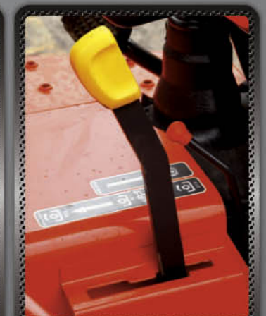
คันเกียร์พืทือ

ให้กำลังขับเคลื่อนเป็นเยี่ยม ถ่ายเทพลังอย่างสมดุลไปยังล้อทั้ง 4 เพิ่มพลังการขับเคลื่อนในการทำงาน ได้แรงจุดลากมาก ล้อไม่หมุนฟรีระหว่างทำงาน มั่นใจ ลุยได้ทุกหล่ม