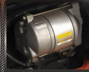
โดสตรายี่ห้อ Denso มาตรฐานระดับโลก