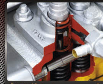
เป็นหัวฉีดหัว Zexel กนทาน มาตรฐานโลก