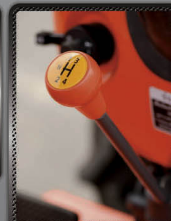
เกียร์หลัก 8 เกียร์เดินหน้า 8 เกียร์ถอยหลัง

คล่องตัวสูงสุดด้วยเกียร์เปลี่ยนทิศทางแบบ ซินโคร ชัทเทิล เปลี่ยนเกียร์เดินหน้า ถอยหลังโดยไม่ต้องหยุดรถทำงานคล่องตัว ว่องไว ไม่ทำงานปรับพื้นที่หรือตีดินในนาได้ความเร็วสูงสุดถึง 22.4 กม./ชม. ทำงานสอดคล้องกับเกียร์หลัก 8 เกียร์เดินหน้า 8 เกียร์ถอยหลัง ครอบคลุมการทำงานหลากหลาย มั่นใจสูงสุดกับสมรรถนะของแทรกเตอร์เจเนอเรชั่นใหม่