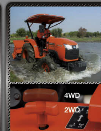
ระบบขับเคลื่อน 4 ล้อ

ผลานการทำงานอย่างลวดลายกับเครื่องยนต์ขนาด 30 และ 36 แรงม้า ให้การถ่ายเทกำลังดีเยี่ยม ลงตัว ได้แรงม้าทำงานเต็มแรง สู้งานทุกสภาพดิน ลุยงานได้ดีกับทุกอุปกรณ์ต่อพ่วง