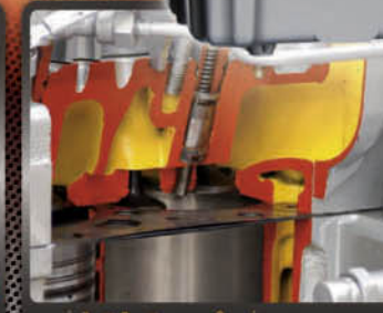
จาลู่อัด ไทเสียขนาดใหญ่