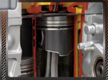
เพนสารเคลือบลูกสูบ ยืดอายุการใช้งาน

เครื่องยนต์ดีเซลคูโบต้า 3 สูบ ระบบไดเร็คอินเจคชั่น พร้อมวาล์วไอดี ไอดีขนาดใหญ่ จุดระเบิดที่หัวลูกสูบ เพาโทรมัดจด ลดอุณหภูมิในการทำงานของเครื่องยนต์ หมดปัญหาเครื่องยนต์ร้อนเร็ว ให้การทำงานต่อเนื่อง ตอมสนองทุกอัตรารองแบ่ทำงานในสภาพอากาศร้อนจัด ความจุกระบอกสูบ 1,499 และ 1,647 ซีซี แรงม้าสูงสุด 30 และ 36 แรงม้า ไร้พลังตีแบง ประสิทธิภาพเยี่ยม ทำงานได้คุณภาพดี ซีดีดีลิค โดยรอบเครื่องยนต์ไม่ตก